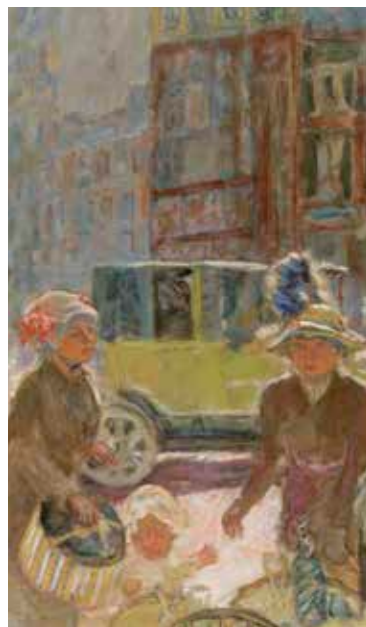
Place Clichy, Pierre Bonnard, 1912