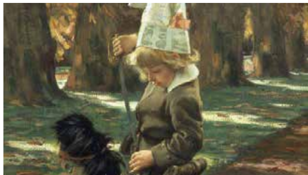
Le Petit Nemrod , James Tissot, 1882

Avec le groupe de travail de Claudy Pellaton ; la classe d'UPE2A du Collège Voltaire et la classe de 6°C du Collège Diderot.