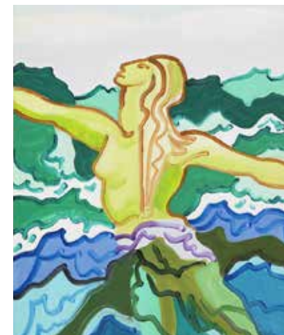
La Naissance d'Aphrodite , Charles Lapicque, 1964

Dans le cadre des parcours d'éducation artistique de la Ville de Besançon. Avec deux classes de CE1 de l'école Albrecht Dürer et deux classes de CE1 de l'école Île de France.