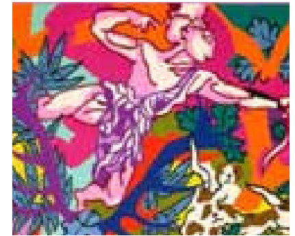
Diane , Charles Lapicque, 1953

Inspiré de la tapisserie Diane , de Charles Lapicque.