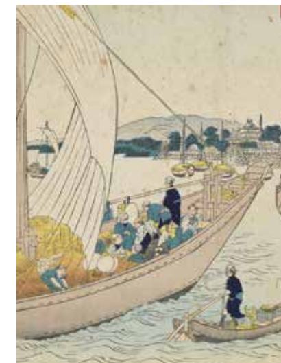
Le Port de Kuwana , 43 e étape du Tokaido, Andō Hiroshige, entre 1833 et 1834

Espace, grande salle 15h - 16h30, durée 30 minutes